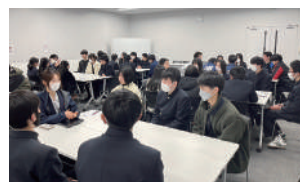
建築デザイン科 座談会